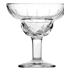
Verre à cocktail

6481 01 H : 9,3 cm ø : 8,4 cm Cl : 34 Oz : 12 7.80LR3.20 6 1152