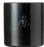
Envolée Mystère Amandes, cannelle, ambre sec Almond, cinnamon, dry amber

6449 05 H : 9,4 cm ø : 8,1 cm 39.00LR16.50 1