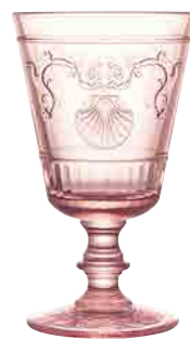
Verre à pied rose*

6293 07 H : 10 cm / ø : 8,5 cm Cl : 25 / Oz : 10,9 7.90LR3.20 6 1152